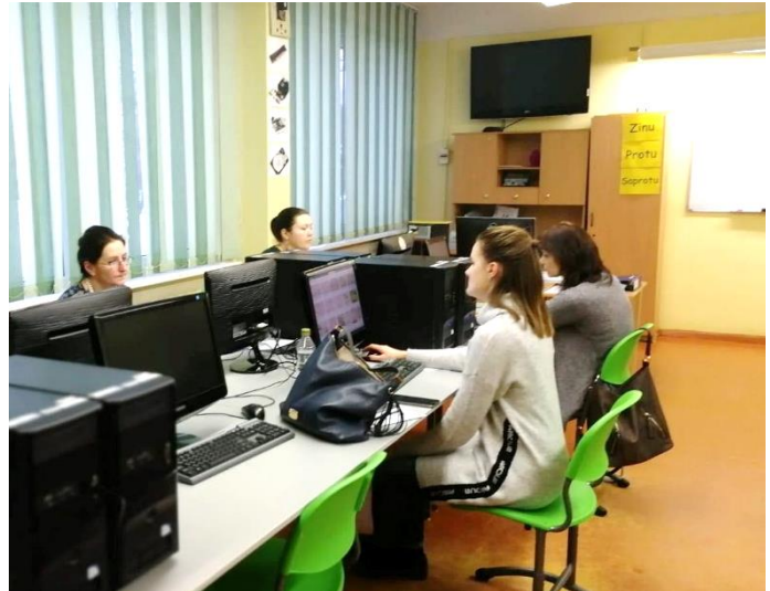
1. un 2. att. Rīgas Klasiskā ģimnāzijas skolotāji kursu “IT prasmes mācību materiālu izstrādei” nodarbību laikā