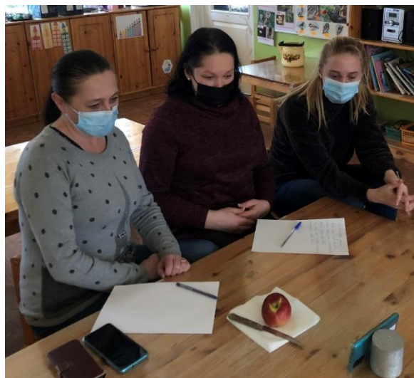
1. – 5. att. Pedagoģi piedalās tiešsaistes nodarbībā